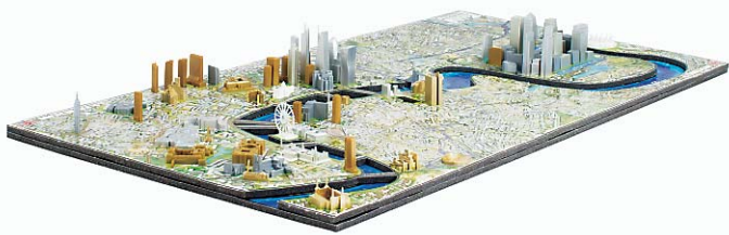
4-dimensionale Städtepuzzles mit bekannten Gebäuden im Miniformat gibt es von der Firma Jumbo. Hier im Bild: London.

★★★ Mit einem Kuschtier die tollsten Geschichten zu erzählen – das können Kinder selbst mit den Living Puppets anstellen, indem sie mit ihren eigenen Händen in die Hände der Puppe oder in ihren plüschigen Kopf hineinschlüpfen. Dann wird den kleinen, kuscheligen Menschen die eigene Stimme geliehen, ihr Mund bewegt sich dank des „Klappmaulprinzips“ und schon kann's losgehen mit der eigenen Puppenshow.